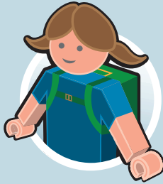
نزهاة في روضة الاطفال و المدرسة

والآن: شاركوا معنا! استعملوا عما هو ممكن محليا. كلموا ايضا على مقربة منكم النوادي التي لم تساهم بعد في حزمة التعليم. قدموا الطلبات في ابكر وقت ممكن و احفظوا الايصالات و الفواتير و اوراق التسجيل. هذه الانجازات متاحة في حزمة التعليم: