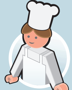
وجبة الغداء في روضة الاطفال و المدرسة و دار الرعاية النهارية للأولاد