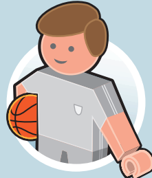
ثقافة و رياضة و ترفيه